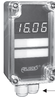
Каб. ввод PG-9

Индикатор PMS-11K предназначен для совместной работы с любым устройством, имеющим выходной сигнал (4 \div 20) мА и оснащенный на выходе стандартным штепсельным разъемом типа DIN 43 650. Основным применением указателя является совмещение местного контроля с дистанционным контролем измерения давления или разности давлений. Индикаторы PMS-11K имеют возможность конфигурации диапазона показаний от -999 до 9999 и позицию десятичной точки. Оснащены дисплеем LED (красным) с высотой цифр 7,62 мм, а также программируемым дискретным выходом типа открытый коллектор (OC). Индикатор не требует дополнительного питания.