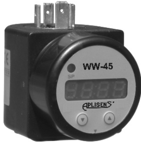
Индикатор PMS-11K (WW-45)